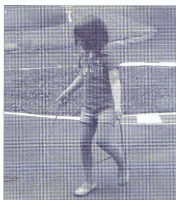
Ups, schon wieder verheddert...