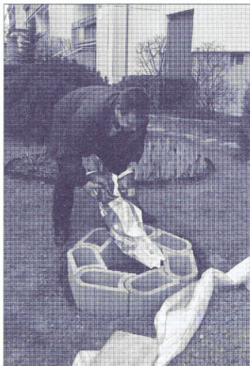
Wer arbeitet, soll auch gut essen... (ganz rechts)