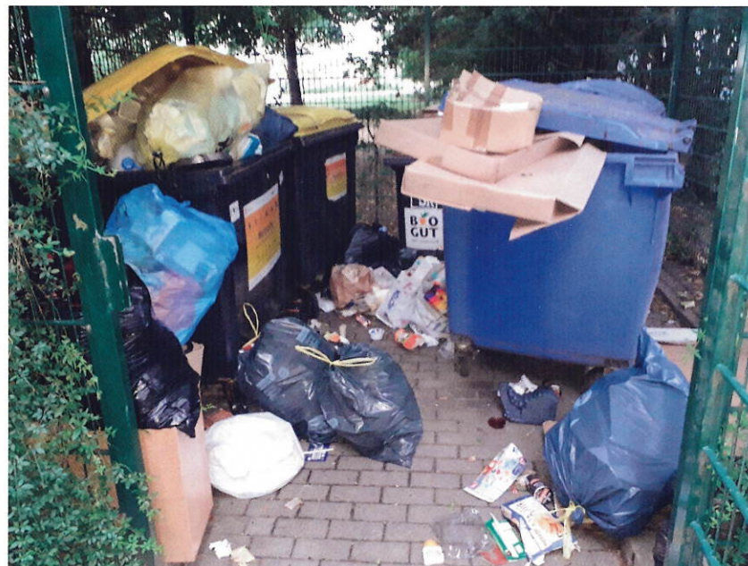
(l.) So sollte der Müllstandplatz aussehen!