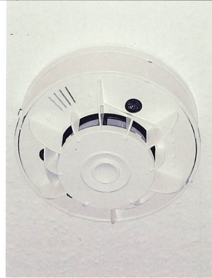
Neu installierter Rauchmelder

Die ALBA Facility Solution GmbH ist schon seit langem unser Partner für die Entsorgung der Pappe- und Papierabfälle gemischt (unsortiert). Durch den massiven Rückgang der Papierexporte nach China um 65 % und die generell schwache Nachfrage der Papierindustrie sahen auch wir uns mit einer Preisanpassung konfrontiert. Durch Verhandlungen konnten wir diese auf ein erträgliches Maß reduzieren und somit auch die Umlagekosten für unsere Bewohner.